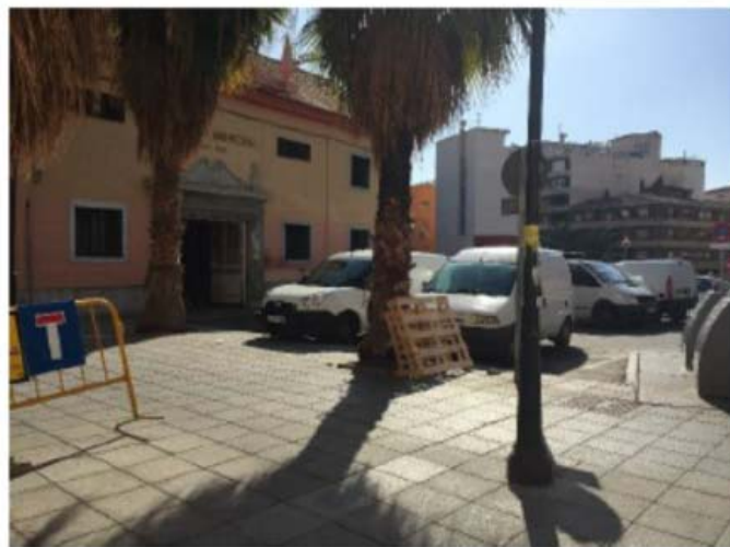
Antes de ejecutar actuación A.4.1a)