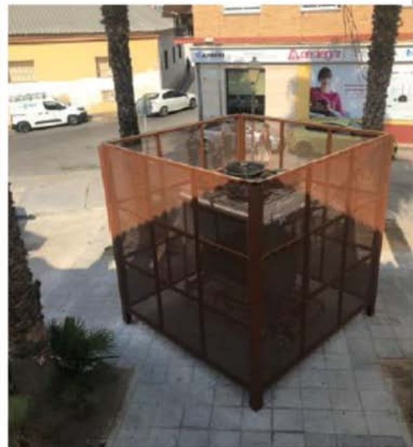
Después ejecución actuación A.4.1a)