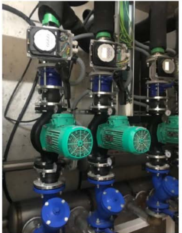
Durante ejecución actuación A.4.1a)