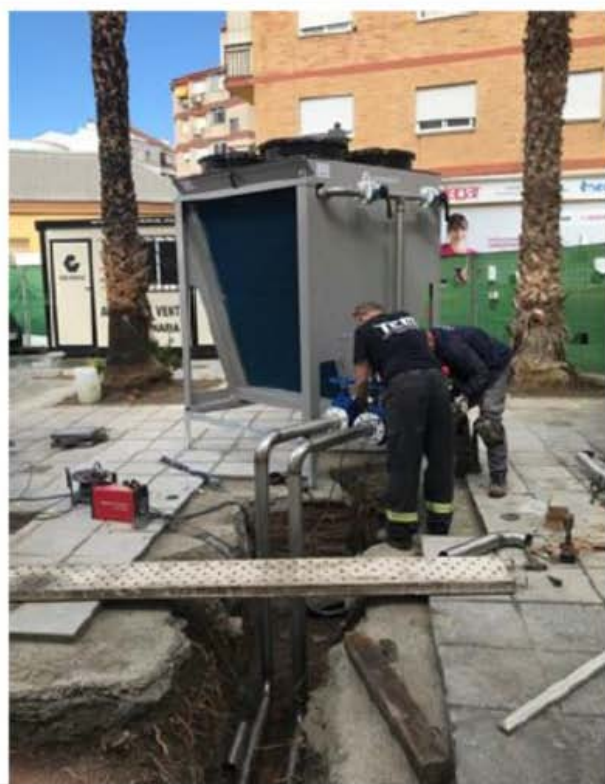
Durante ejecución actuación A.4.1a)