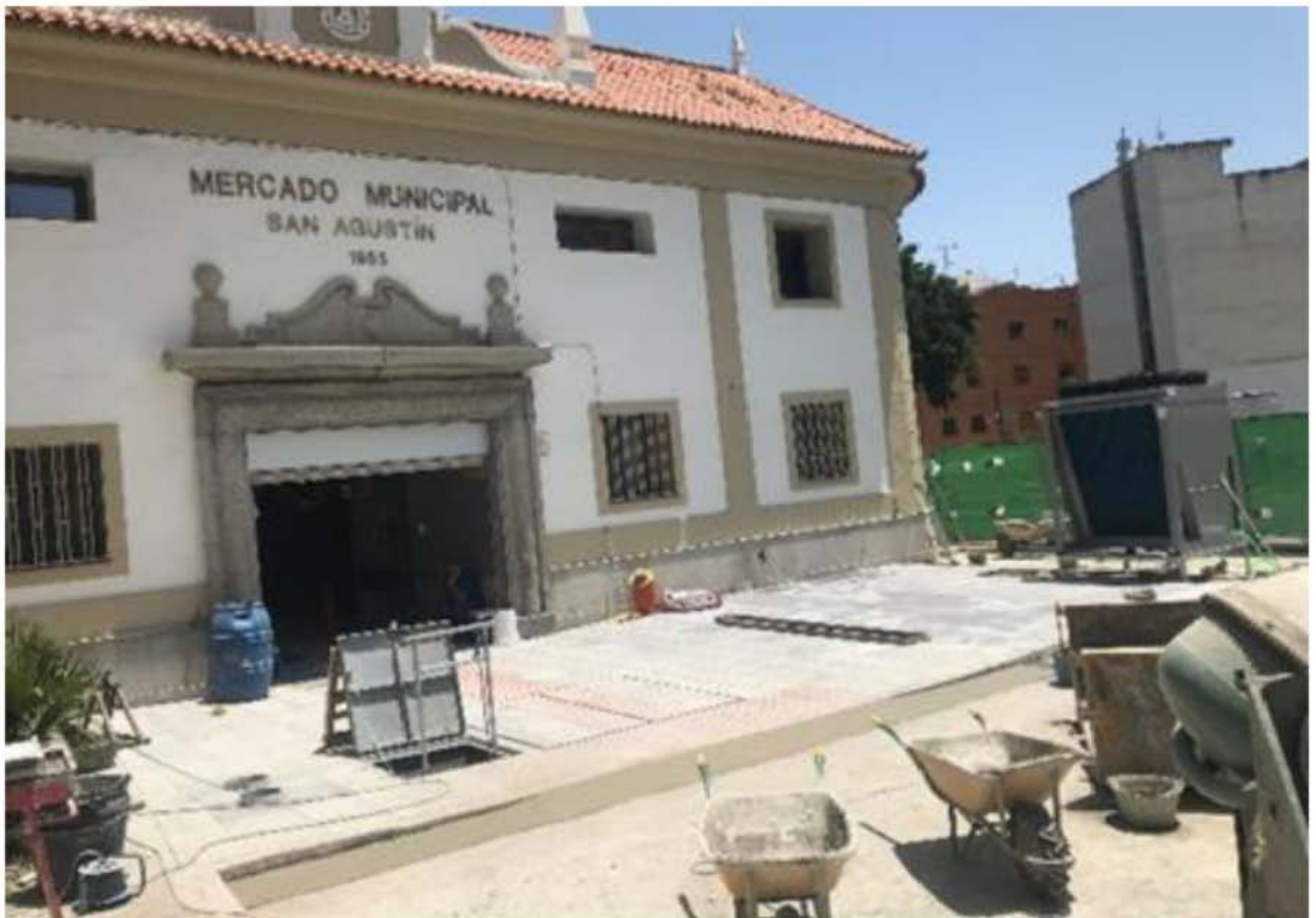
Durante ejecución actuación A.4.1a)