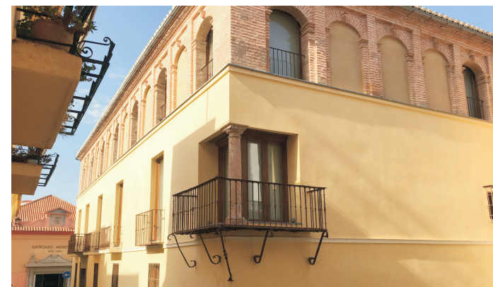
IEE Informe de Evaluación del Edificio

- Se evita la depreciación de los edificios manteniendo o aumentando su valor de mercado y mejorando las expectativas de alquiler o venta, ya que un IEE favorable constituye una garantía para vendedores, compradores o arrendatarios del buen estado del inmueble.